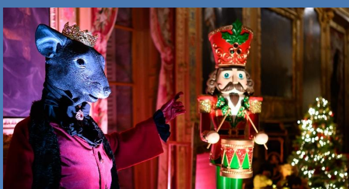
LES NOËLS TRADITIONNELS : Le grand Froid, les gourmandises de Dame Tartine, La Reine des Neiges, les chants de Mélodie, Casse-Noisette, Saint-Nicolas