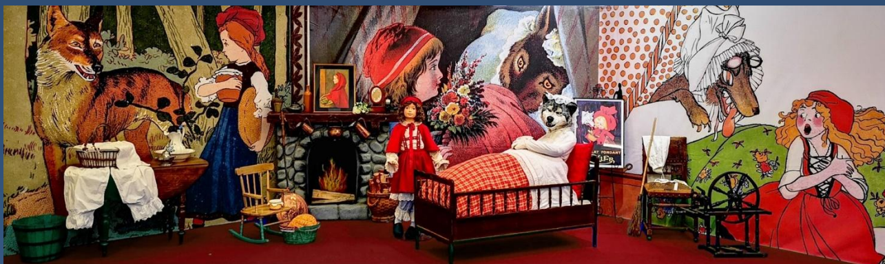
LES CONTES DE PERRAULT : Le Chat botté, Le Petit Chaperon rouge, Cendrillon, Le Petit Poucet, Barbe bleue, Peau d'Ane, Riquet à la Houppe

Adaptables à tout type de monument et espace culturel Direction artistique assurée par le Duo Diapason Installations de personnages, de décors, de vidéoprojections avec des ambiances lumineuses et sonores de qualité