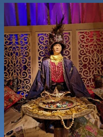
PRINCES ET PRINCESSES : Le Roi Grenouille, Blanche-neige, Le Rossignol et l'Empereur de Chine, La Belle et la Bête, Aladin et la lampe merveilleuse